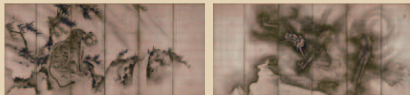
『竜虎図屏風』雪村周継筆/クリーブランド美術館蔵 Facsimiles of Shide's Japanese. 1504-1589. Dragon, Tiger. Pair of six-fold screens; ink on paper. 171.5 x 365.8 cm, 157.2 x 339.0 cm. The Cleveland Museum of Art. Purchase from the J.H. Wade Fund. 1959.136.1-2.

寺院内では京都文化協会とキヤノン株式会社が共同で推進する綴プロジェクトにて制作された文化財高精細複製品が展示されます。保存のため公開できない作品や、海外所蔵のため日本で見ることで見えない作品の高精細複製品が、本物に代わって日本文化の魅力を伝えます。秋の日本建築の中で見る日本画の粋をご堪能下さい。