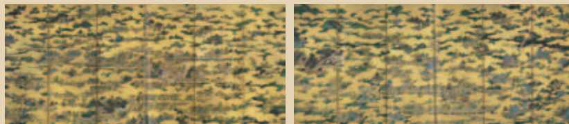
国宝『上杉本 洛中洛外図屏風』狩野永徳筆/米沢市上杉博物館蔵